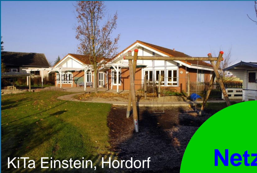
KiTa Einstein, Hordorf