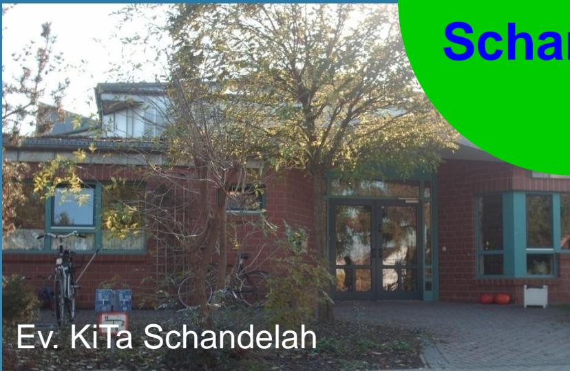
Ev. KiTa Schandelah