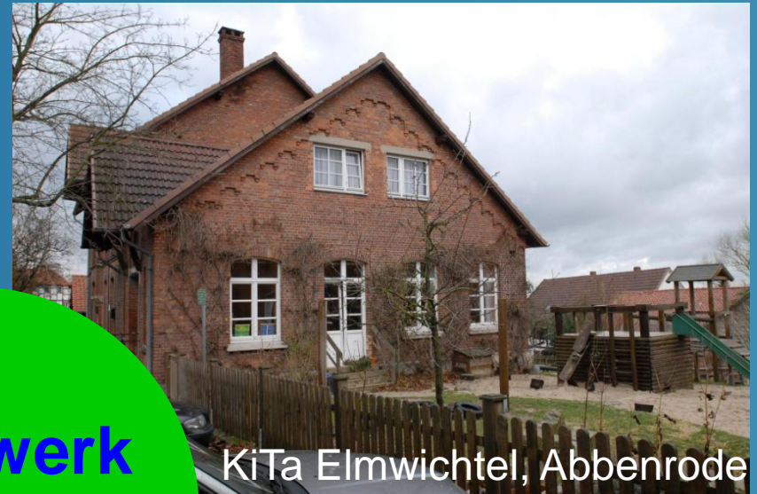
KiTa Elmwichtel, Abbenrode